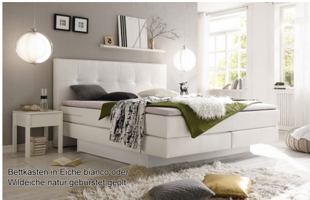
Bettkasten in Eiche bianco oder Wildeiche natur gebürstet geölt